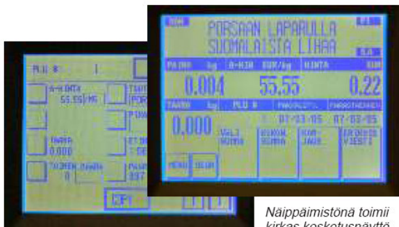
Näppäimistönä toimii kirkas kosketusnäyttö

Jos käytössä on useita erilaisia etikettejä, niin irroitettava etiketti- kassetti helpottaa ja nopeuttaa niiden käyttöä merkittävästi.