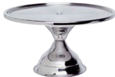
Tortenplatte auf Fuß Chrom-Nickel-Stahl