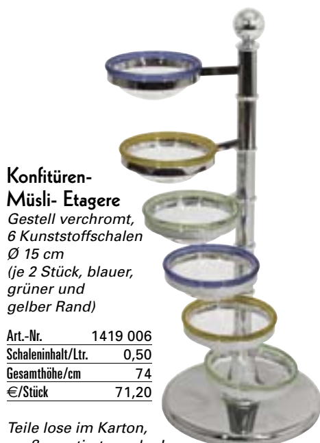
Konfitüren- Müsli- Etagere Gestell verchromt, 6 Kunststoffschalen Ø 15 cm (je 2 Stück, blauer, grüner und gelber Rand)

passend Art.-Nr. 4961 260 / 4963 300 extra bestellen!