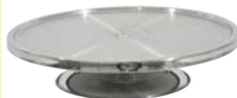
Tortenplatte - auf Fuß - schwere Chrom-Nickel-Stahl Ausführung