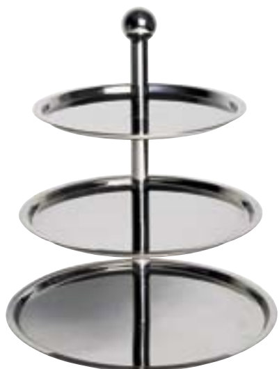
Etagere 3-stufig schwere Qualität, Chrom-Nickel-Stahl