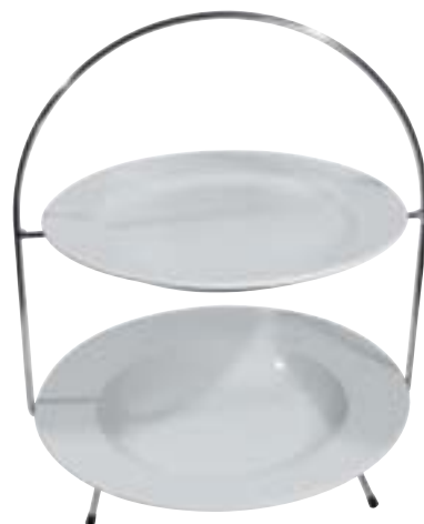
Teller-Etagere 2-stufig - ohne Teller -