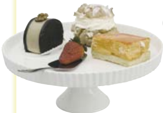
Porzellan-Tortenplatte auf Fuß Rand geriffelt