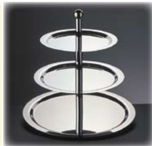
Etagere 3-stufig schwere Qualität Edelstahl, Kugelgriff vergoldet Ø 48 / 38 / 32 cm, Höhe 50 cm