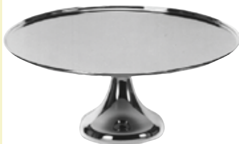
Tortenplatte auf Fuß Chrom-Nickel-Stahl extra schwer