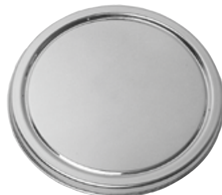
Tortenplatte auf Fuß - drehbar Chrom-Nickel-Stahl