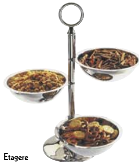
Etagere 18/8-18/10 für Nüsse / Salzgebäck oder Milch / Zucker usw.