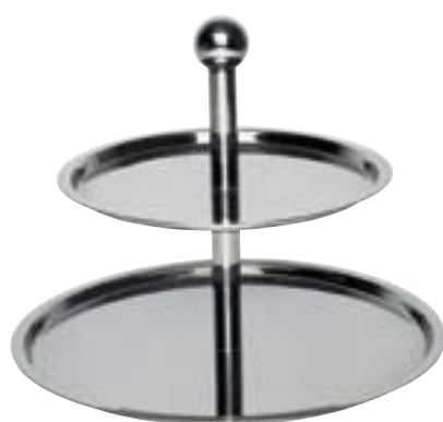
Etagere 2-stufig schwere Qualität, Chrom-Nickel-Stahl