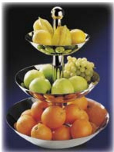
Etagere für Obst 3-stufig (tiefe Schalen) 18/8-18/10, Rohre verchromt, Messing-Kugelgriffe, vergoldet