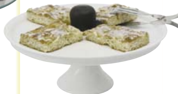
Porzellan-Tortenplatte auf Fuß