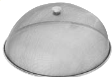
Abdeckhaube für Tortenplatte Edelstahlgaze