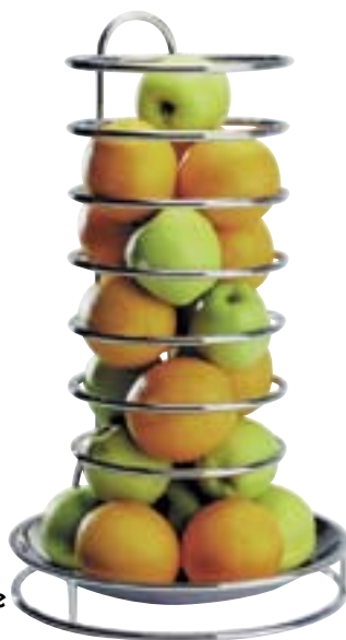
Etagere für Früchte 18/8-18/10 Metalldraht verchromt