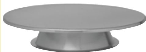
Tortenplatte auf Fuß Chrom-Nickel-Stahl