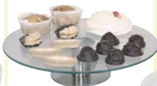
Glas-Tortenplatte drehbar - Fuss: Edelstahl