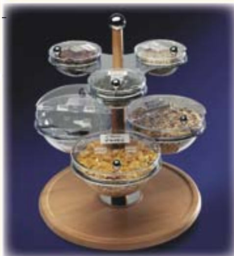
Konfitüren- / Müsli-Etagere 3-stufig, 13-teilig

Teile lose im Karton, muß montiert werden!