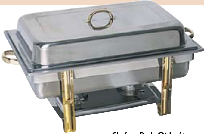
Chafing-Dish GN 1/1 65 mm, keine Montage, keine losen Teile, keine Schrauben, komplett im Karton mit Brennpastenbehälter und GN-Schale, mit Deckelhalterung am Gestell.