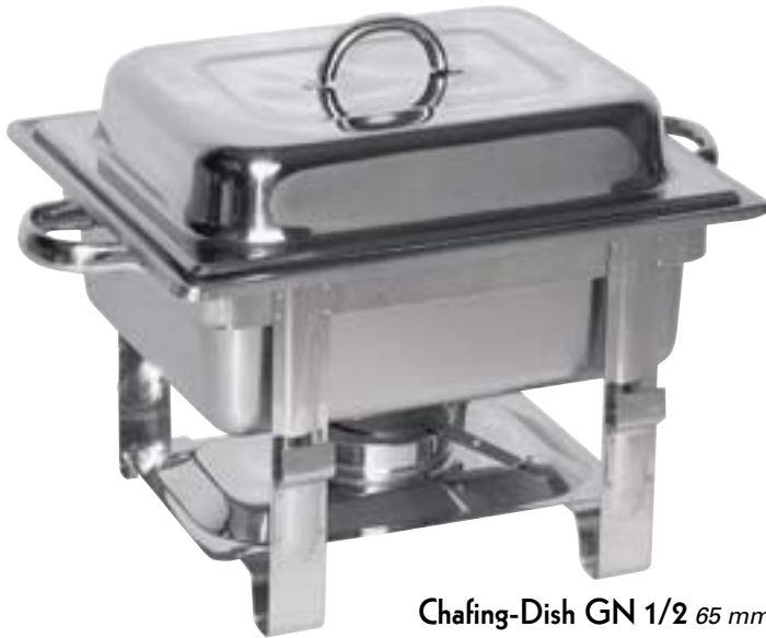
Chafing-Dish GN 1/2 65 mm