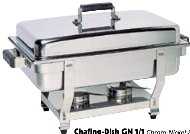
Chafing-Dish GN 1/1 Chrom-Nickel-Stahl neue, verbesserte Ausführung, Deckel jetzt seitlich und quer aufstellbar, Kunststoffgriffe Holzdekor, komplett mit GN-Behälter 65 mm Keine Montage, da bereits komplett montiert im Karton.