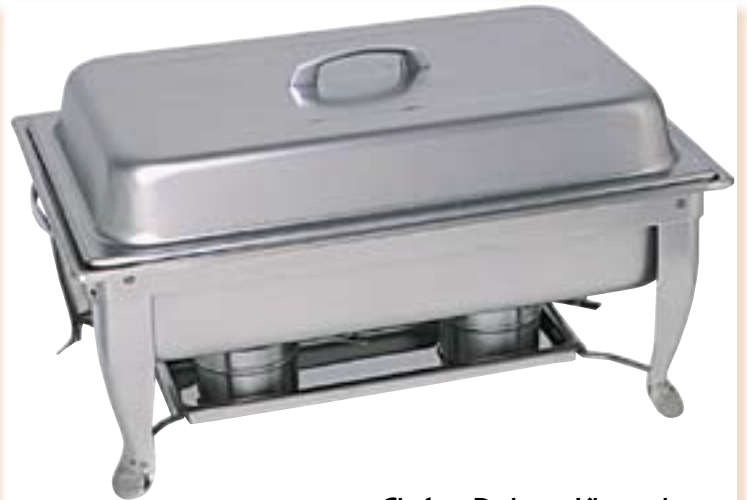
Chafing-Dish mit Klapprahmen komplett mit GN 1/1 65 mm und 2 Brennpastenbehältern Besonderer Vorteil: Zusammenklappbarer Rahmen, daher raumsparend bei Transport und Lagerung