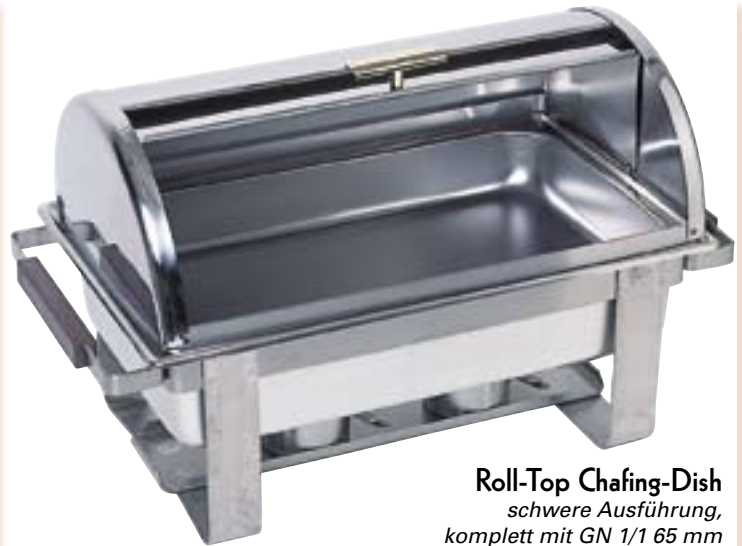
Roll-Top Chafing-Dish schwere Ausführung, komplett mit GN 1/1 65 mm und 2 Brennpastenbehältern