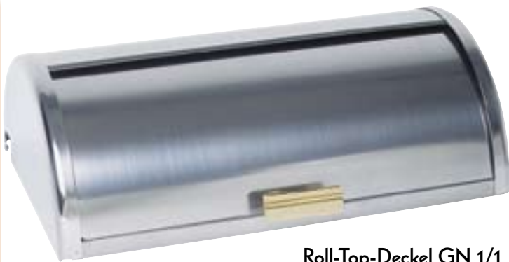
Roll-Top-Deckel GN 1/1 mit Messinggriff für Chafing-Dishes und GN-Behälter