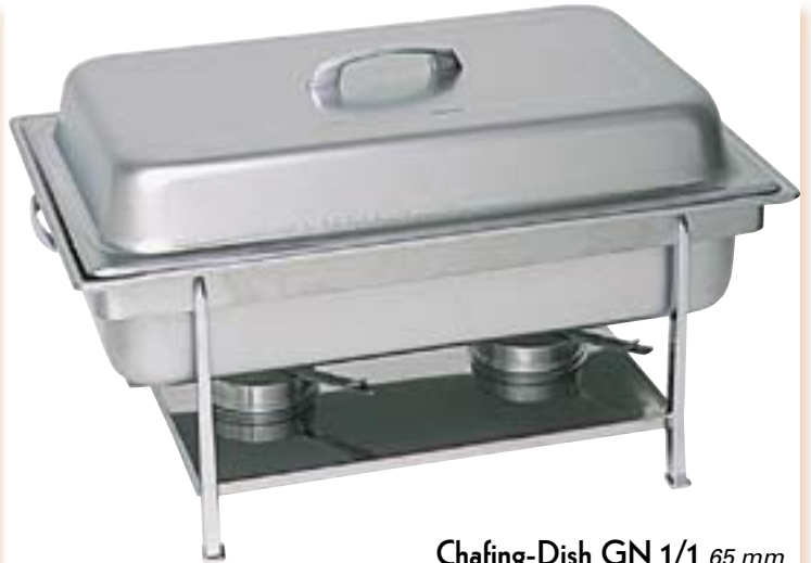
Chafing-Dish GN 1/1 65 mm keine Montage, keine losen Teile, komplett montiert im Karton mit Brennpastenbehälter und GN-Behälter 65 mm, Griffe und Füße verchromt