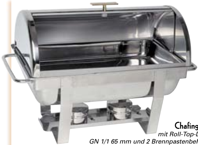
Chafing-Dish mit Roll-Top-Deckel, GN 1/1 65 mm und 2 Brennpastenbehältern