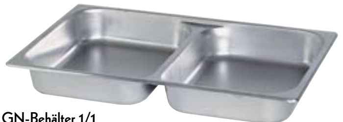
GN-Behälter 1/1 mit fester Unterteilung, 2 Schalen 1/2 65 mm