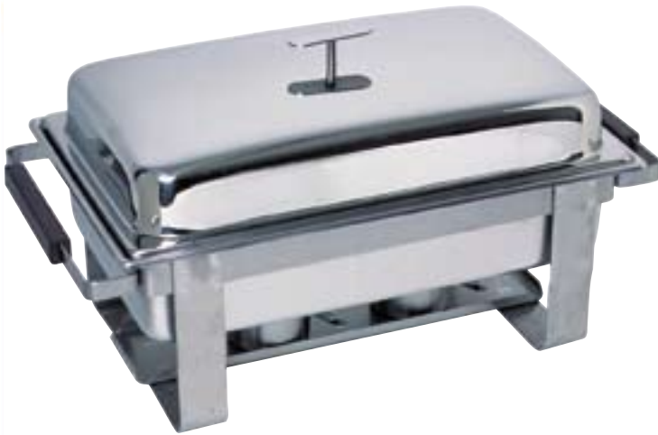
Chafing-Dish mit Domdeckel schwere Ausführung, komplett mit GN 1/1 65 mm und 2 Brennpastenbehältern