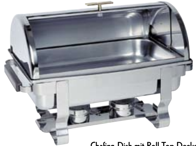
Chafing-Dish mit Roll-Top Deckel komplett mit GN 1/1 65 mm und 2 Brennpastenbehältern, Kunststoffgriffe