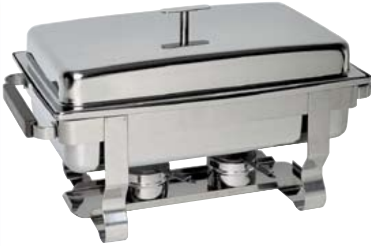
Chafing-Dish Chrom-Nickel-Stahl schwere Ausführung komplett mit GN 1/1 65 mm und 2 Brennpastenbehältern, Kunststoffgriffe