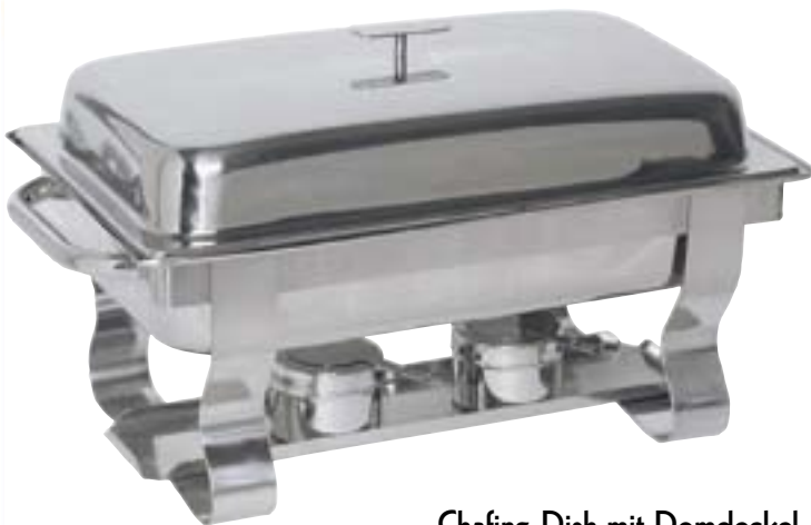
Chafing-Dish mit Domdeckel extra schwere Ausführung, komplett aus Chrom-Nickel-Stahl mit 1/1 GN und 2 Brennpastenbehältern