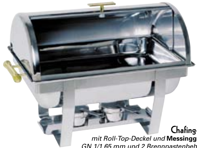
Chafing-Dish mit Roll-Top-Deckel und Messinggriffen, GN 1/1 65 mm und 2 Brennpastenbehältern