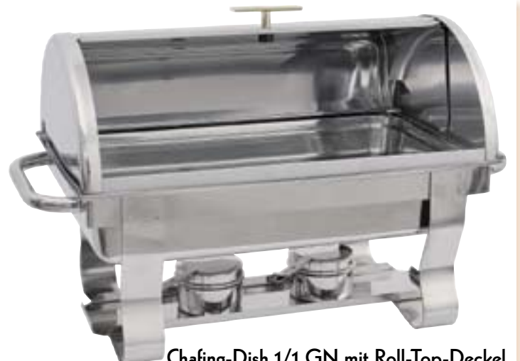
Chafing-Dish 1/1 GN mit Roll-Top-Deckel extra schwere Ausführung, komplett Chrom-Nickel-Stahl mit 1/1 GN und 2 Brennpastenbehältern