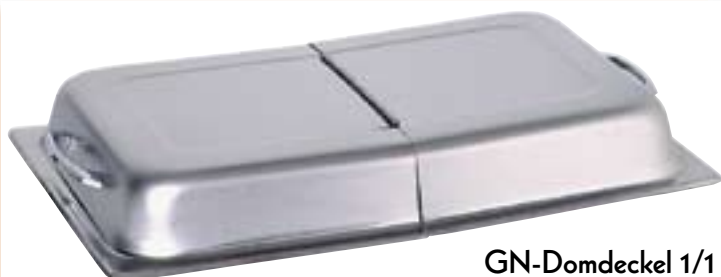
GN-Domdeckel 1/1 mit Scharnier für Chafing-Dishes und GN-Behälter