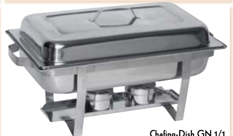
Chafing-Dish GN 1/1 keine Montage, keine losen Teile, keine Schrauben, komplett im Karton mit GN-Behälter 1/1 65 mm und 2 Brennpasten-behältern, Gestell Edelstahl; Wasserbad, GN-Behälter, Brennpastenbehälter und Deckel Chrom-Nickel-Stahl.