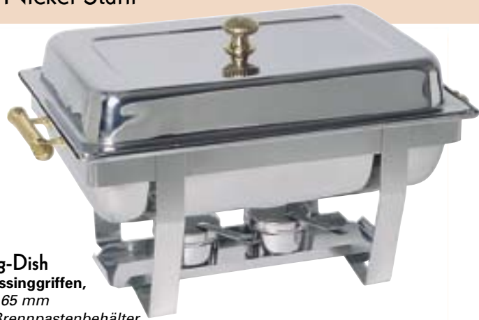
Chafing-Dish mit Messinggriffen, GN 1/1 65 mm und 2 Brennpastenbehälter