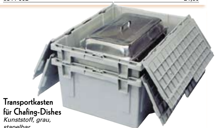
Transportkasten für Chafing-Dishes Kunststoff, grau, stapelbar