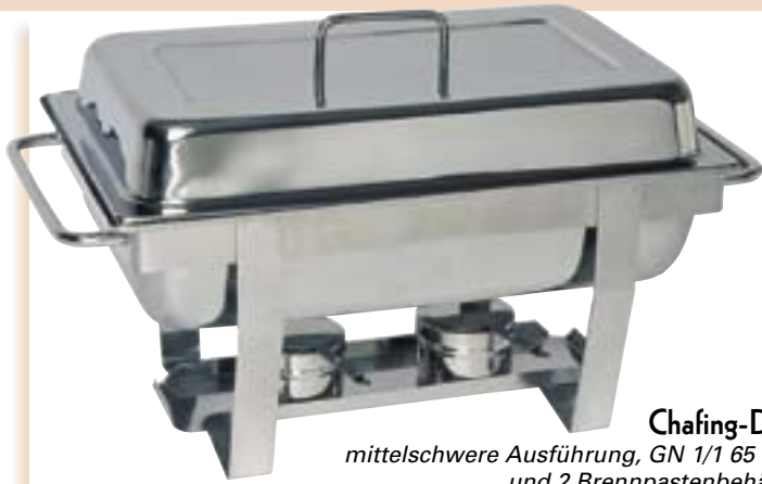
Chafing-Dish mittelschwere Ausführung, GN 1/1 65 mm und 2 Brennpastenbehälter