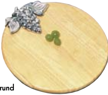
Obst- / Käsebrett rund