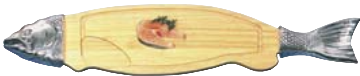
Lachs- / Fischbrett