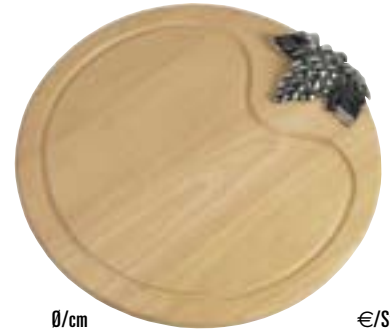
Obst- / Käsebrett rund mit Rille