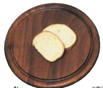
Steakteller mit Safrille