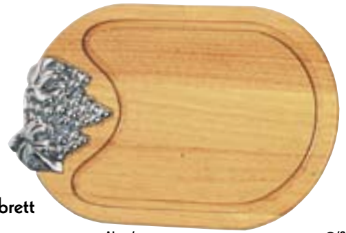
Obst- / Käsebrett